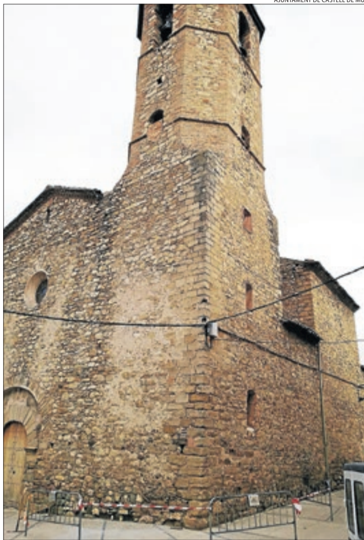
Les tanques al voltant del campanar de Guàrdia de Noguera.

Aquestes obres consistiran a renovar els bastidors, enganxaments i suports i la instal·lació d'un nou sistema de mecanització que permeti que les campanes puguin tornar a girar. D'aquesta manera, Guàrdia de Noguera podrà recuperar la tercera campana. El primer edil va apuntar que "les campanes són un element patrimonial important", que toquen els quarts, les hores, la celebració de les misses i la mort dels veïns.