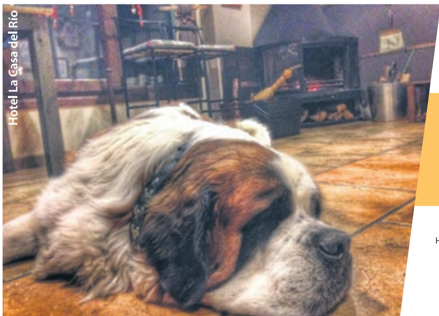
Hotel La Casa del Río

Camins ■ La brigada del Parc Natural ha reparat aquesta setmana baranes i senyals del camí de la Canerilla entre Rialp i Sort, on es van produir desprendiments de roques.